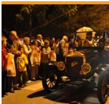
Desfile de autos antiguos.