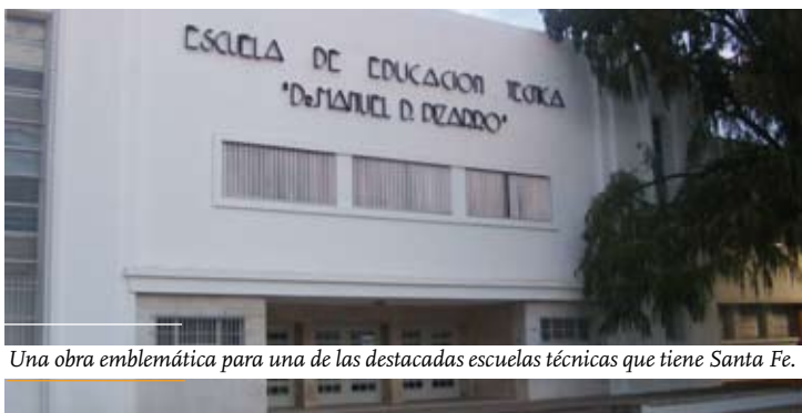
Una obra emblemática para una de las destacadas escuelas técnicas que tiene Santa Fe.

Autoridades provinciales y municipales compartieron con la comunidad de la Escuela Técnica N° 479 "Manuel Pizarro" la inauguración de las obras de remodelación del establecimiento, que forma parte del patrimonio urbano y arquitectónico de la ciudad. Todos los días asisten 785 alumnos en los tres turnos de una de las escuelas emblemáticas de la educación técnica, que está recuperando su merecido reconocimiento para el desarrollo de la ciudad.