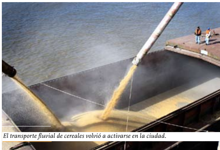
El transporte fluvial de cereales volvió a activarse en la ciudad.

Mirar el futuro con optimismo es lo que propone la postal con las tolvas volcando 3 mil toneladas de cereales desde los silos del Puerto de Santa Fe. La salida de la carga de granos acopiados en la terminal local para ser transportados por vía fluvial a través de barcazas, dejó la expectativa de que esa imagen se transforme nuevamente en una rutina. La actividad formó parte de la política de reactivación comercial impulsada por la actual gestión del Ente Portuario. En tanto, en poco tiempo más se instalará la primera empresa en el Área Industrial con que contará Santa Fe.