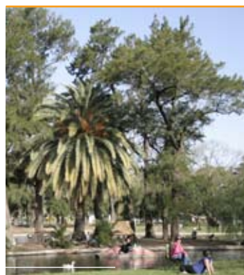
2009. La recuperación.