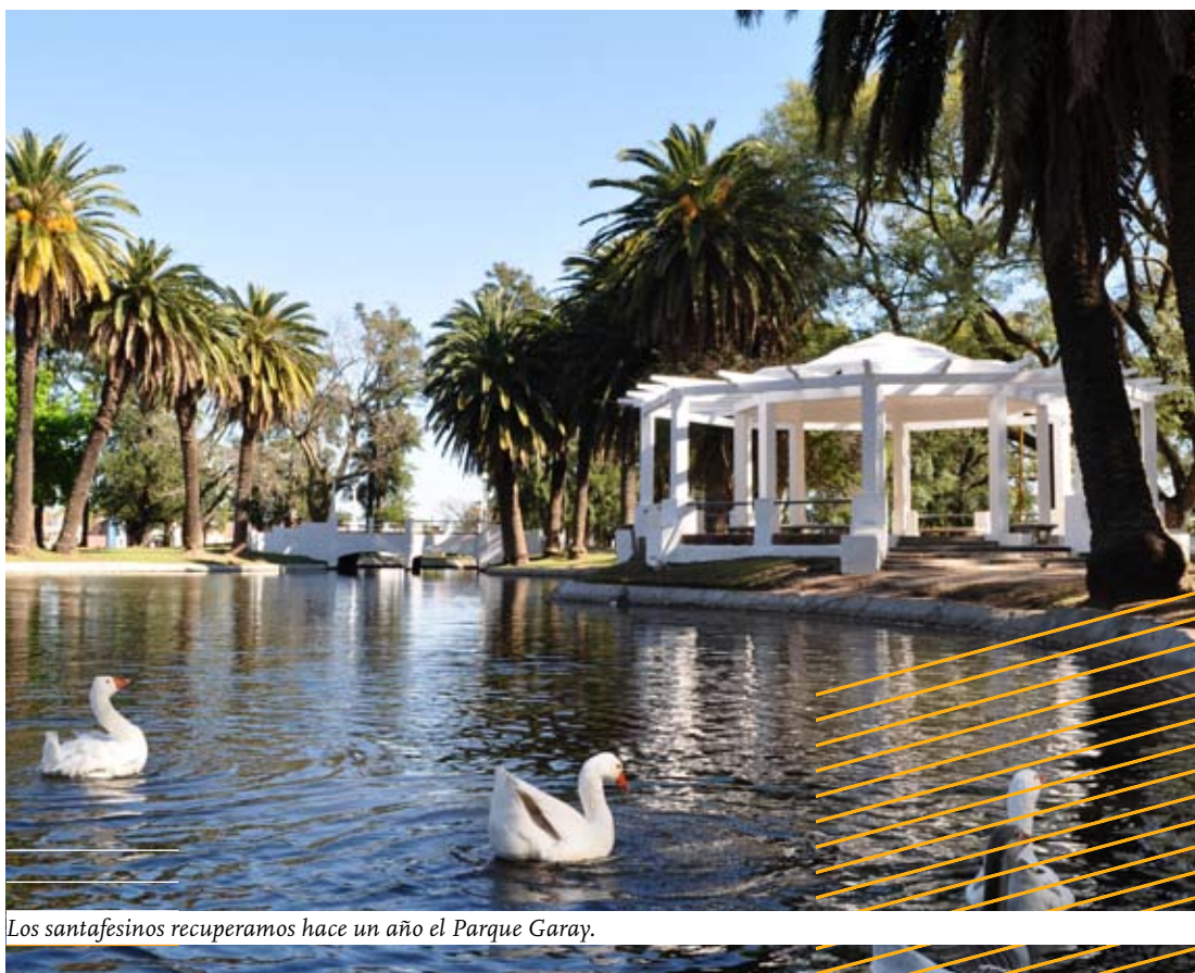
Los santafesinos recuperamos hace un año el Parque Garay.