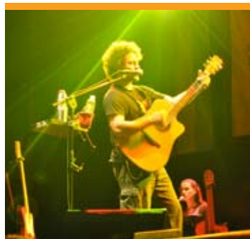
Recital de Raly Barrionuevo.