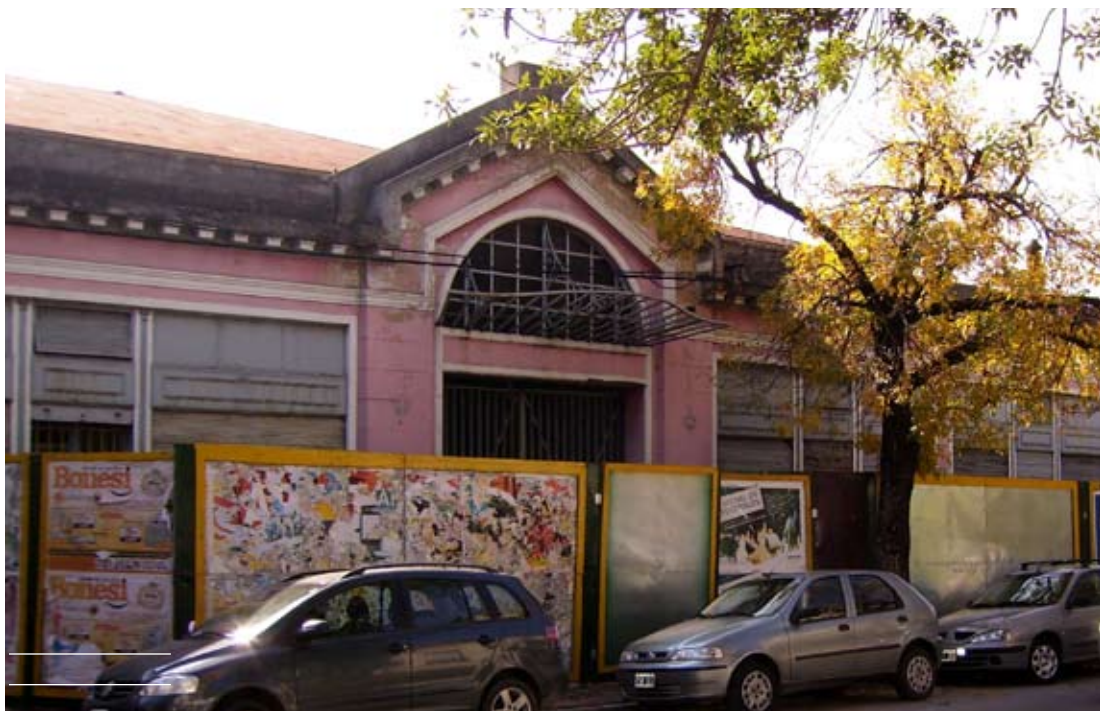
En el histórico edificio ya se derribaron tabiques internos y se instaló la cinta verde.