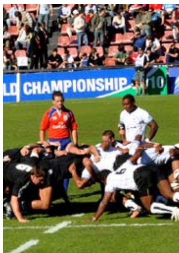
En el estadio del Club Colón se jugó el Mundial Juvenil de Rugby.