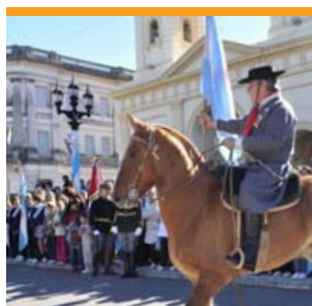
Tradicional desfile de Mayo.

La celebración del Bicentenario constituye una oportunidad para rescatar el rol protagónico de Santa Fe en la constitución de la Nación.