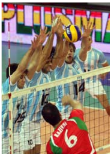
La Selección Argentina de vóley protagonizó la Copa Santa Fe Ciudad.