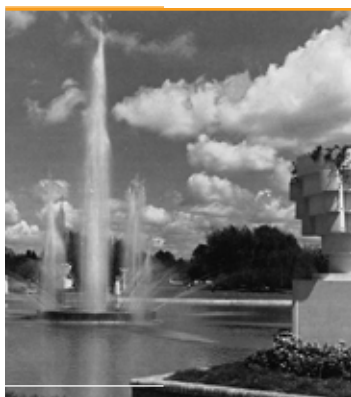
1939. La inauguración.