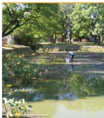
2003/08. El olvido.