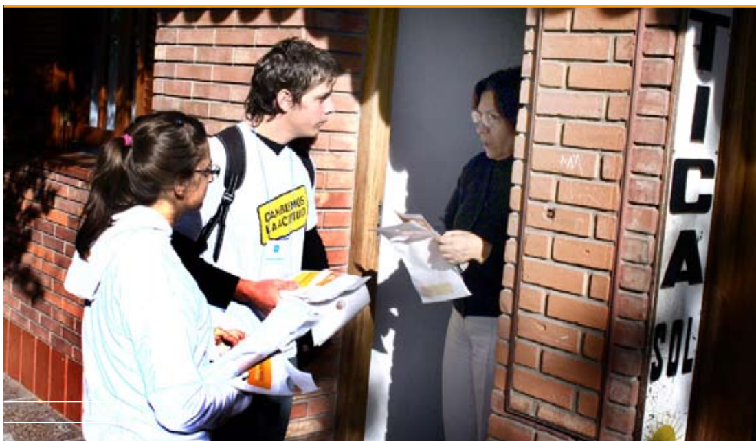
“Cambiemos la actitud” es la consigna con la que los voluntarios llegan hasta los hogares con volantes explicativos.