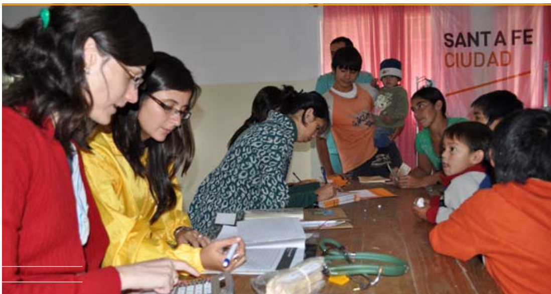
El comedor del Barrio Los Troncos es un nuevo Solar de la ciudad.