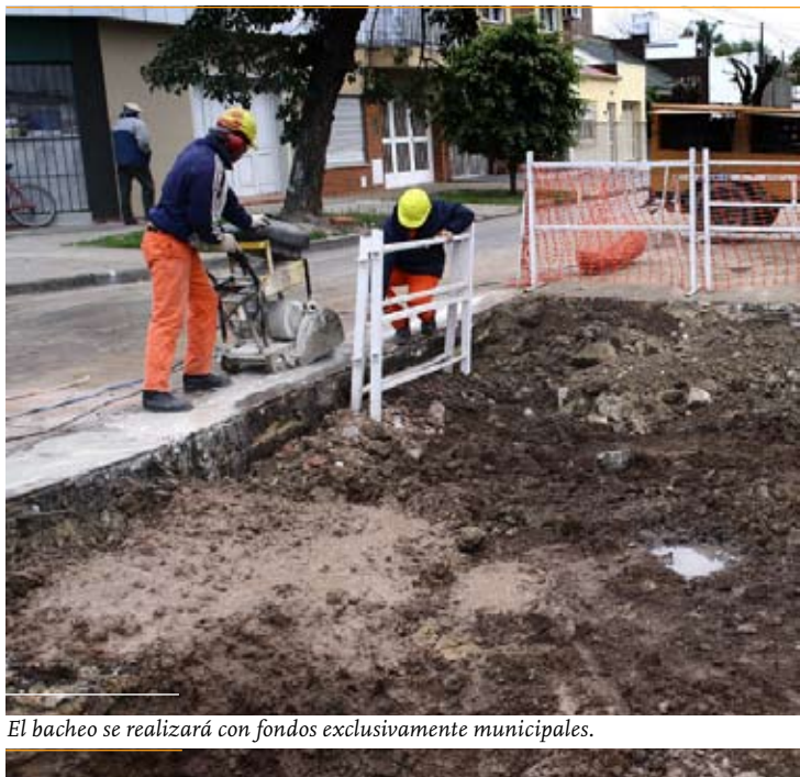
El bacheo se realizará con fondos exclusivamente municipales.