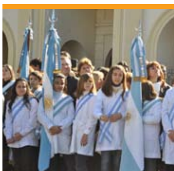
Acto en la Plaza 25 de Mayo.