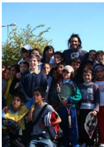
Zabaleta jugó con los chicos, en el marco del Santa Fe Tennis Show 2010.