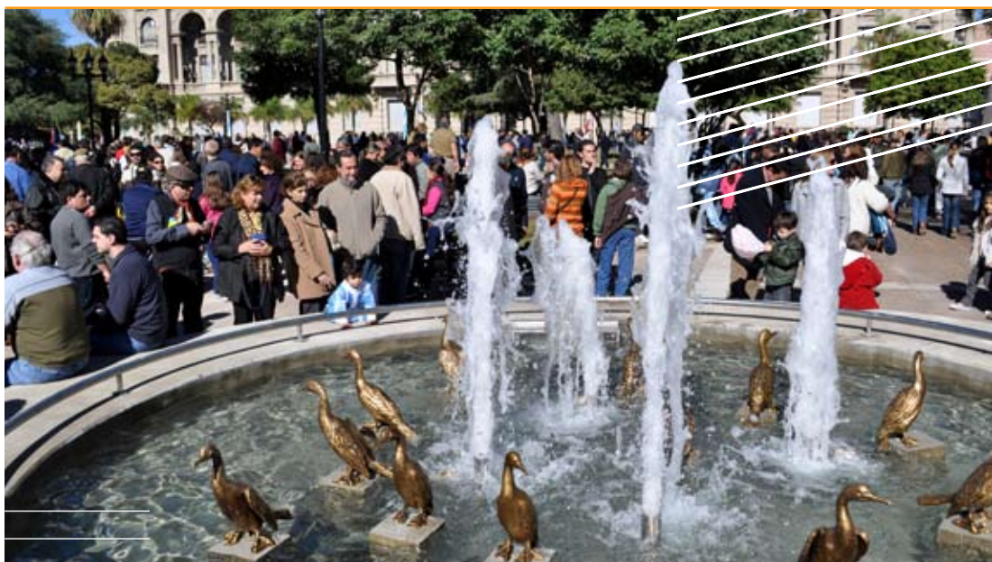
Desde la plaza 25 de Mayo se promueven los rumbos posibles del Camino de la Constitución.