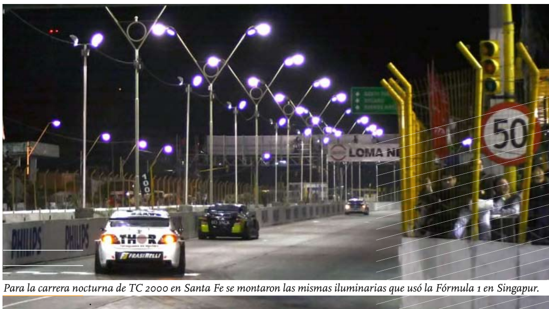
Para la carrera nocturna de TC 2000 en Santa Fe se montaron las mismas iluminarias que usó la Fórmula 1 en Singapur.

La carrera se ejecutará nuevamente en el trazado de las avenidas 27 de Febrero y Alem que fue equipado con luces de alta tecnología.