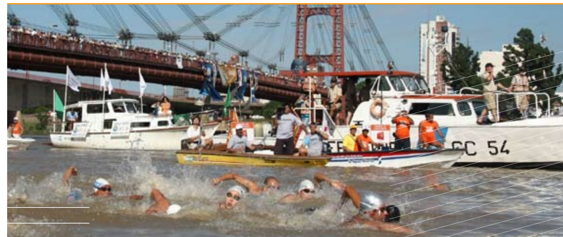
Sus 63 kilómetros la hacen una de las pruebas más relevantes del calendario mundial.