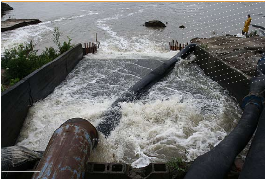
Las estaciones de bombeo, piezas clave en el sistema de drenaje urbano.