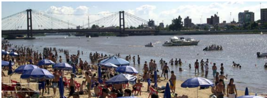
Tomar los debidos recaudos nos permite disfrutar sin riesgos el verano.