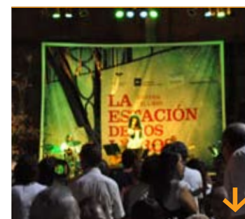
Feria del libro