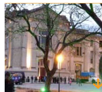
Día del patrimonio