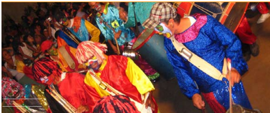
La ciudad se reencontrará con los ritmos de batucada y el color del carnaval.