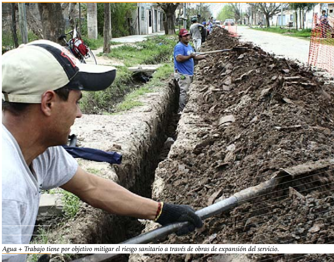
Agua + Trabajo tiene por objetivo mitigar el riesgo sanitario a través de obras de expansión del servicio.