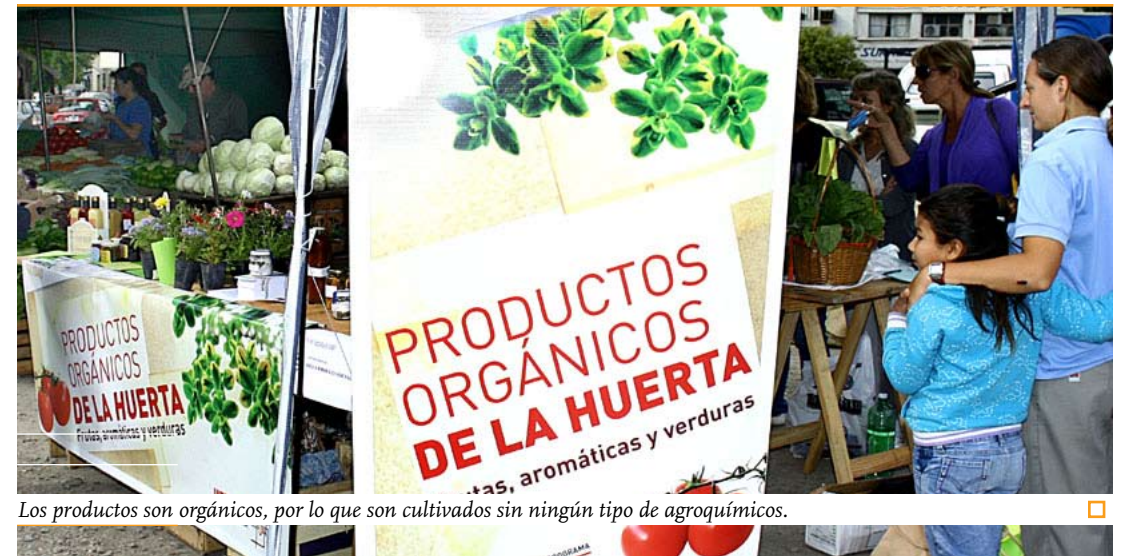
Los productos son orgánicos, por lo que son cultivados sin ningún tipo de agroquímicos. □

La Escuela Julio A. Roca de Colastiné tiene nuevo comedor. La obra se concretó con dinero que el municipio aportó al Fondo de Asistencia Educativa, con una inversión de 570 mil pesos. Avanza a buen ritmo la restauración de los sanitarios de la institución, donde concurren 180 chicos, que lo seguirán haciendo durante las vacaciones. Además se edificó un aula y un baño.