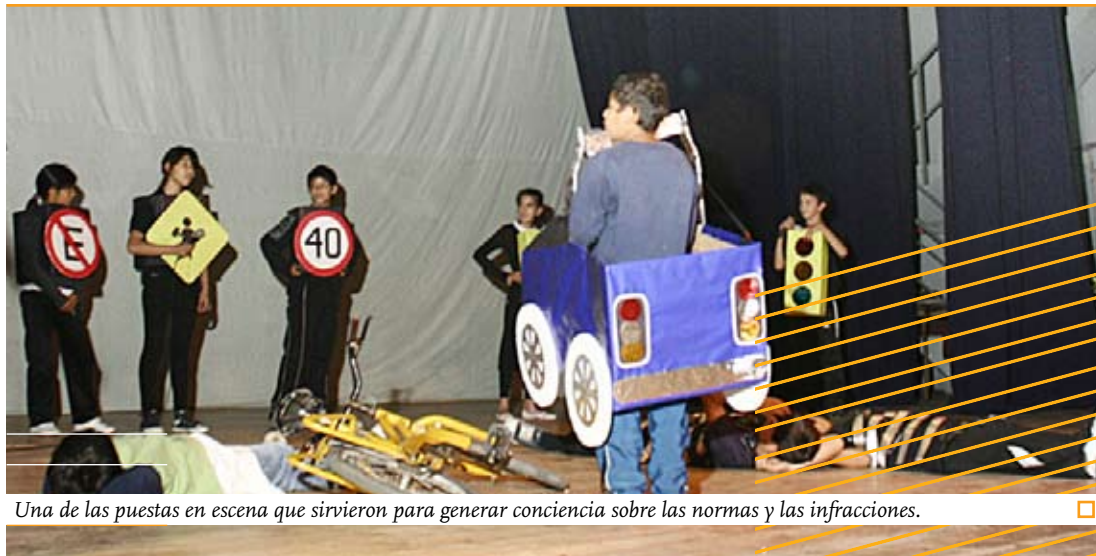
Una de las puestas en escena que sirvieron para generar conciencia sobre las normas y las infracciones. □