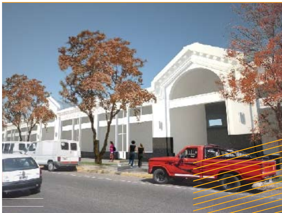
La nueva imagen del emblemático edificio de Urquiza y Santiago del Estero.