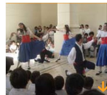
Fiesta de Colectividades