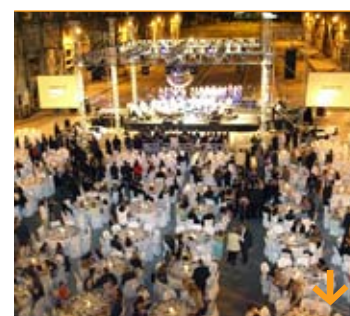
436° aniversario de la Ciudad