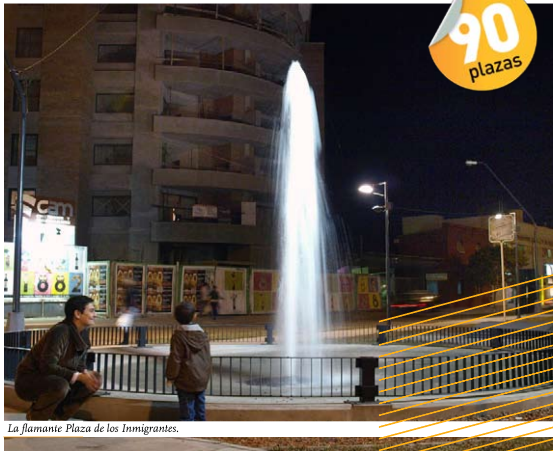
La flamante Plaza de los Inmigrantes.