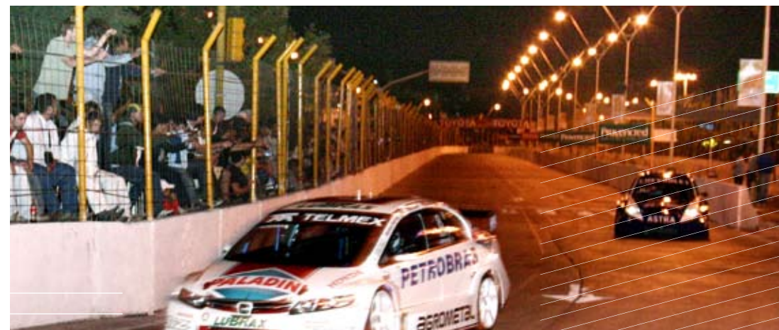
El circuito será probado por pilotos experimentados antes de la competencia nocturna.