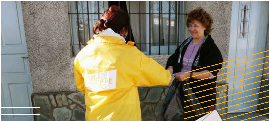
Voluntarios y el Municipio concientizan sobre acciones de prevención.