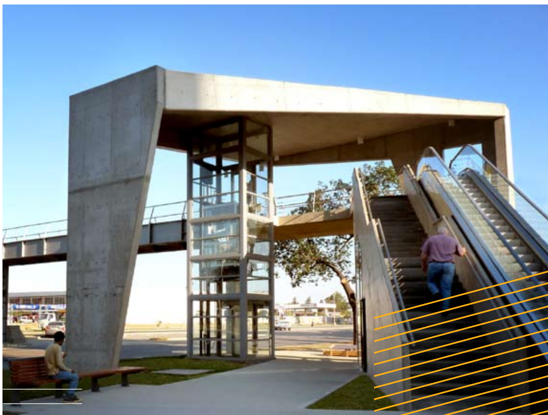
La pasarela peatonal de Avenida 27 de Febrero, la nueva postal santafesina.