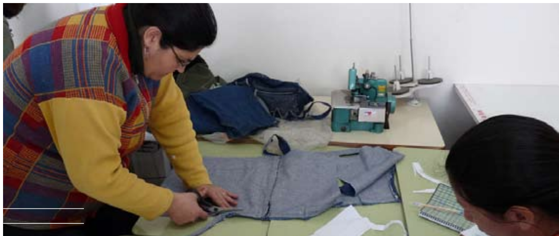
Más de 500 personas vienen participando de los cursos de capacitación.