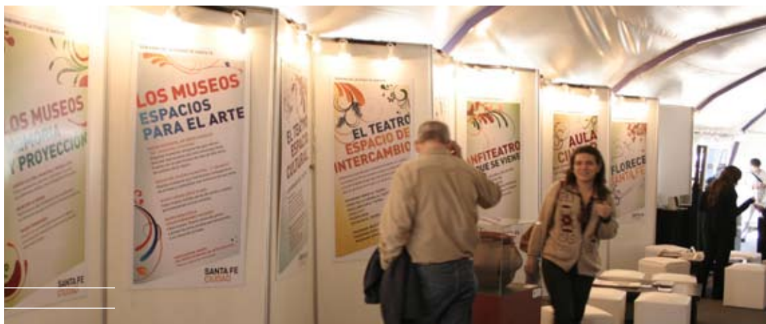
La Feria del Libro se muda este año a la Estación Belgrano.