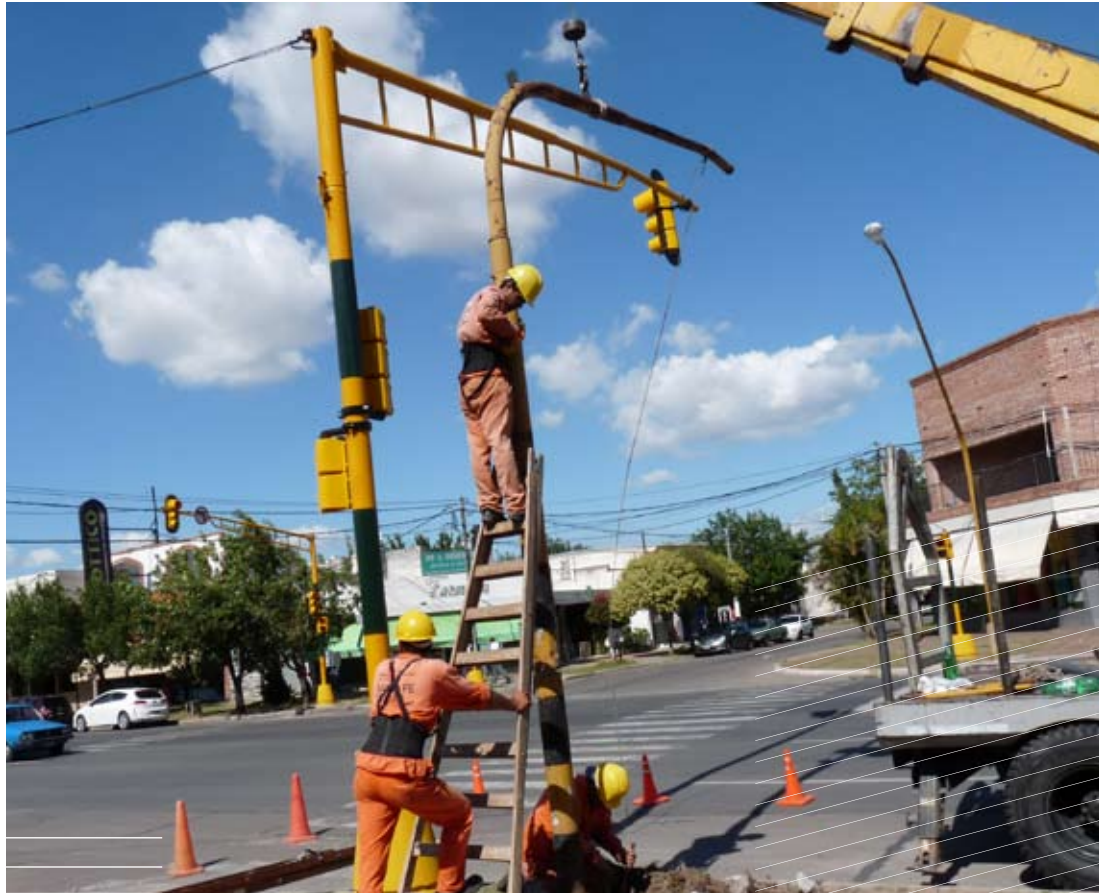
Los nuevos semáforos se monitorean desde la Central de Tránsito.