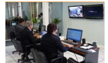
Centro de Control, ubicado en el Palacio Municipal.

El desarrollo de este sistema es el resultado de un esfuerzo conjunto entre el municipio, el Centro Comercial y la Asociación Amigos de Calle San Martín, quienes se ocuparon de convocar a las firmas que apadrinan el Sistema de Seguridad.