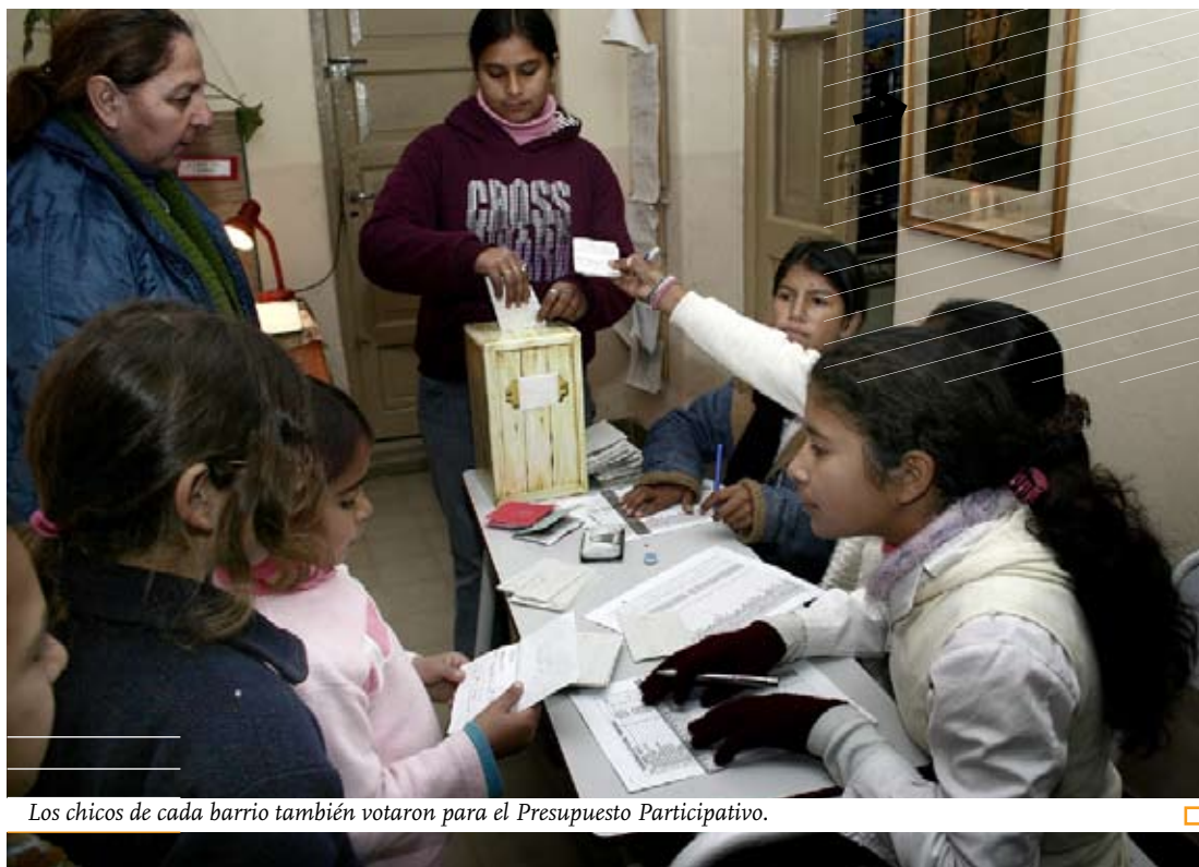
Los chicos de cada barrio también votaron para el Presupuesto Participativo.