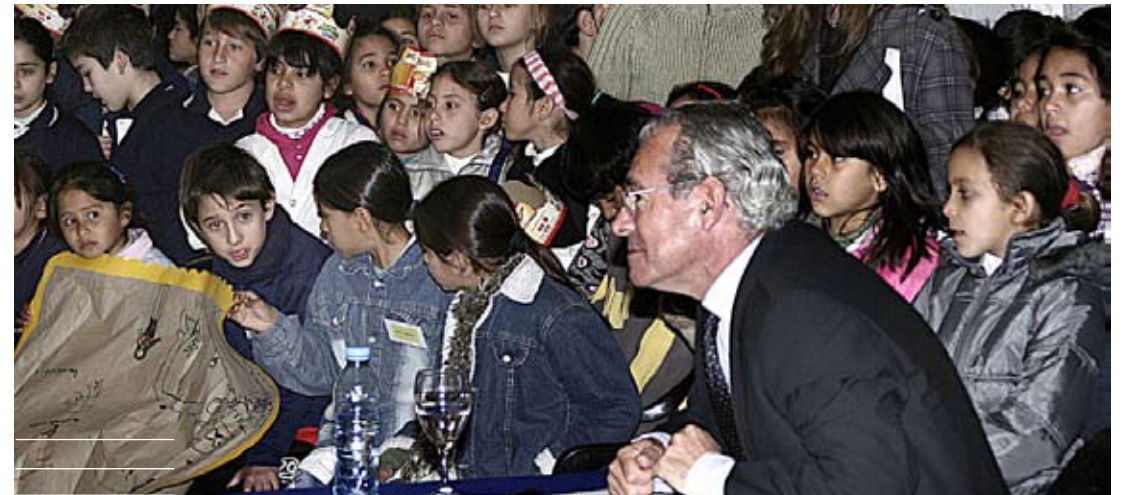
Las niñas y niños se hacen escuchar.

Usar repelente y telas mosquiteras para evitar la picadura de mosquitos.